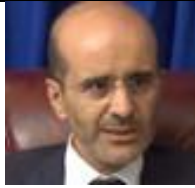
Dr. Driss El Azami El Idrissi

Né le 16 septembre 1966 à Fès, est un homme politique marocain, membre du Parti de la justice et du développement. Actuellement Maire de Fès En fonction depuis le 4 septembre 2015