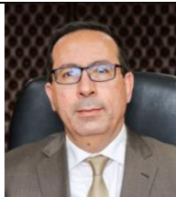
Pr. Radouane MRABET

Le 4 septembre 2015, le PJD remporte les élections municipales à Fès et le 15 septembre, Driss El Azami est élu président de la commune urbaine (maire).